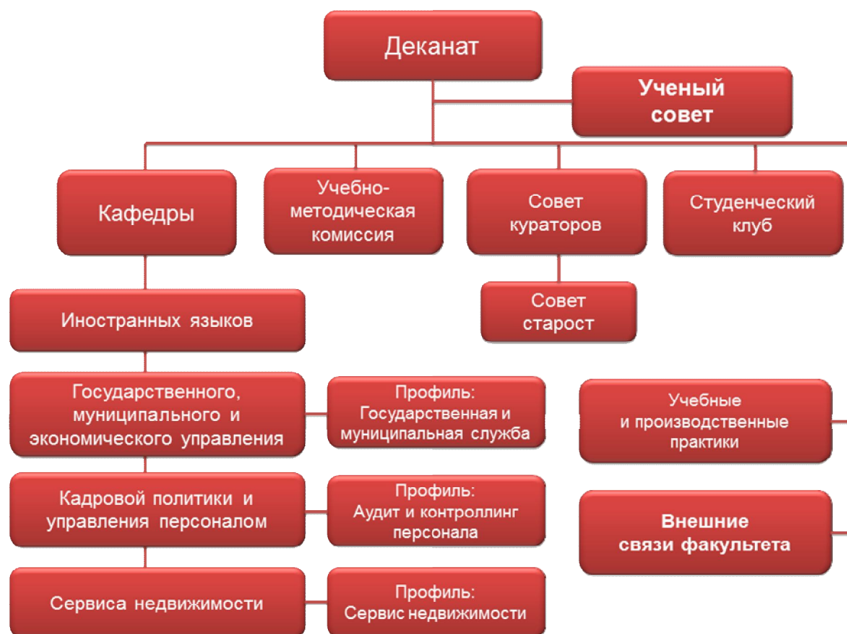
Рис. 1. Структура и органы управления факультета ГМУ