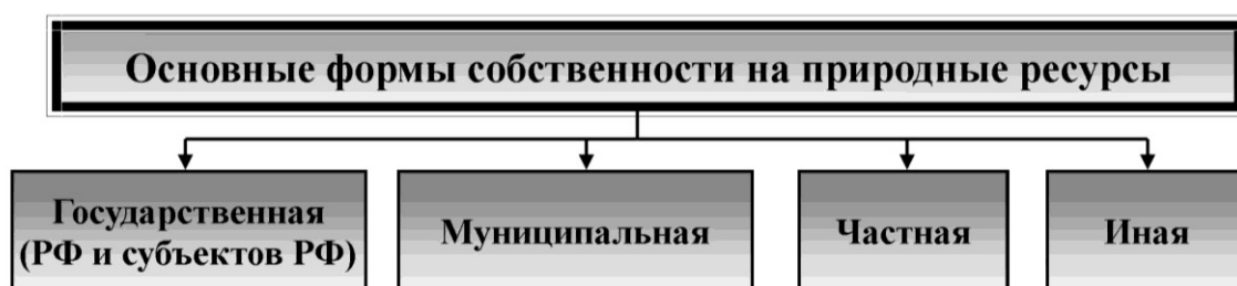
Рис.3. Формы собственности на природные ресурсы