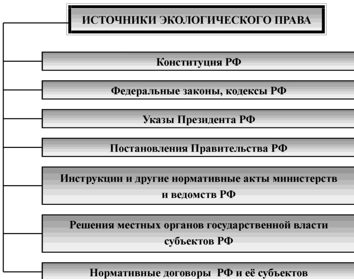
Рис. 2. Источники экологического права

2. Разобрать и зарисовать в тетрадь схему, приведённую на рис. 2, «Источники экологического права». Привести примеры каждой позиции источника экологического права. Вычленить основополагающие законные, подзаконные ведомственные акты в области природопользования, охраны окружающей среды и обеспечения экологической безопасности. Сделать вывод.